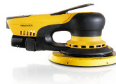
Mirka® Deros 650CV Ø150 mm, órbita 5 mm